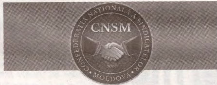
PUBLICAȚIE PERIODICĂ A CONFEDERAȚIEI NAȚIONALE A SINDICATELOR DIN MOLDOVA