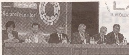
Congresul VIII al FSEȘ, un moment de cotitură în mișcarea sindicală >>> p.2