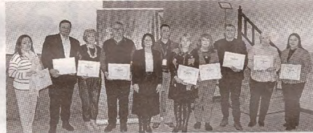
Consiliul FSCM a analizat și aprobat subiecte esențiale >>> p.4