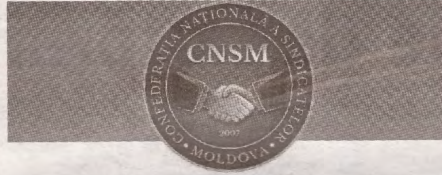
PUBLICAȚIE PERIODICĂ A CONFEDERAȚIEI NAȚIONALE A SINDICATELOR DIN MOLDOVA