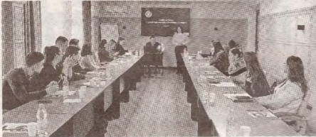
Tinerii sindicaliști la ora bilanțului: obiectivele pentru anul curent >>> p.3