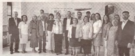
Parteneriatul Local de Ocupare, în curs de implementare la Hâncești » c.3