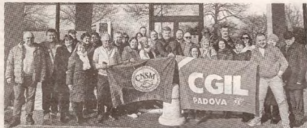
CNSM aprofundează cooperarea cu Confederația Generală Italiană a Muncii » p.2