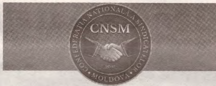
PUBLICAȚIE PERIODICĂ A CONFEDERAȚIEI NAȚIONALE A SINDICATELOR DIN MOLDOVA