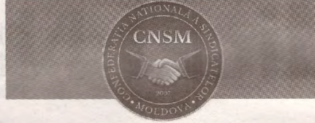
PUBLICAȚIE PERIODICĂ A CONFEDERAȚIEI NAȚIONALE A SINDICATELOR DIN MOLDOVA