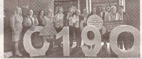
Prioritatea unei societăți democratice – respectarea egalității de gen