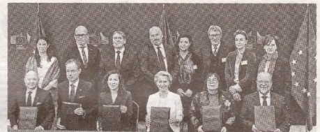
ETUC a semnat Pactul pentru dialog social cu Comisia Europeană >> p.4