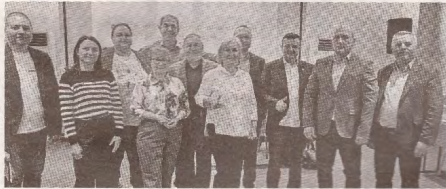
Sindicatul din sectorul public din Europa de Sud-Est și viitorul muncii >> p.2