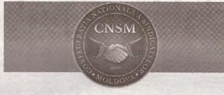
PUBLICAȚIE PERIODICĂ A CONFEDERAȚIEI NAȚIONALE A SINDICATELOR DIN MOLDOVA