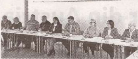
Sindicaliștii din Moldova dezvoltă » p.2 cooperarea cu omologii lor din Austria