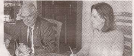
„SOCIEUX+” este deschisă să contribuie la îmbunătățirea dialogului social » p.3