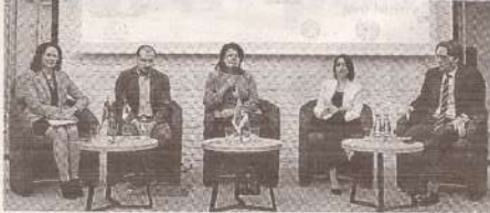
НКСС запустила кампанию «Пособия без препятствий» в поддержку детей >> с.3