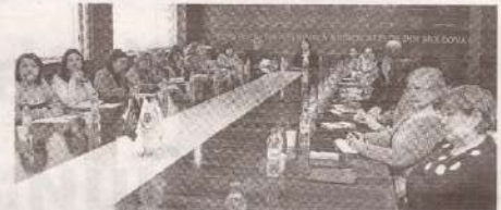
Специалисты федераций рассмотрели вопросы организационной деятельности >> с.4