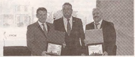
Социальные партнеры стройотрасли отметили свой профпраздник >> с.5