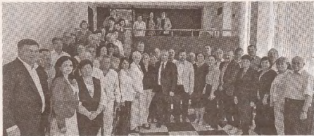
FSEȘ вновь призывает к повышению заработной платы педагогов >> с.3