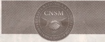
PUBLICAȚIE PERIODICĂ A CONFEDERAȚIEI NAȚIONALE A SINDICATELOR DIN MOLDOVA