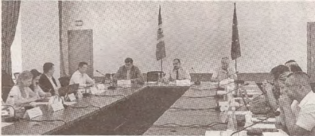
Sindicatele și patronatul pledează pentru majorarea salariului minim >>> p.3