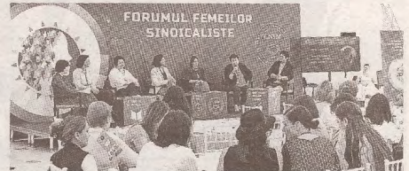
Integrarea tinerelor pe piața muncii: probleme și realizări >>> p.5