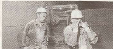
Securitatea și sănătate în muncă, pe lista priorităților CNSM