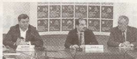
Comisia tripartită va examina chestiuni esențiale pentru societate