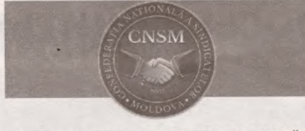
ПЕРИОДИЧЕСКОЕ ИЗДАНИЕ НАЦИОНАЛЬНОЙ КОНФЕДЕРАЦИИ ПРОФСОЮЗОВ МОЛДОВЫ