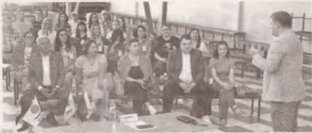
Роль молодых людей в обществе: как им реализовать себя >>> с.3