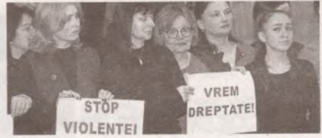
Планируется ужесточение наказаний за оскорбление педагогов >>> с.5