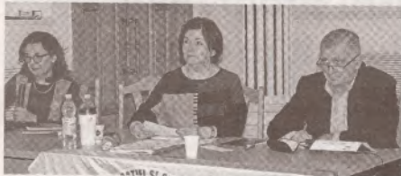
Campania de alegeri în sindicat: reguli, provocări și oportunități >> p.3