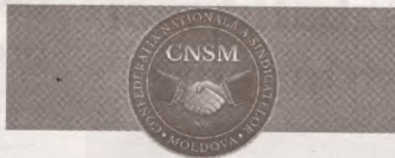
PUBLICAȚIE PERIODICĂ A CONFEDERAȚIEI NAȚIONALE A SINDICATELOR DIN MOLDOVA