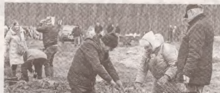
Sindicaliștii la plantat puieți care vor crește o pădure deasă >> p.4