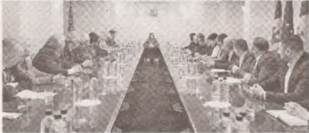
Maia Sandu a discutat cu liderii CNSM despre referendumul privind aderarea la UE >> p.2