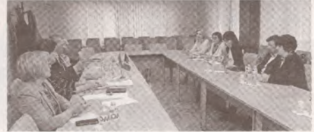
FSE a înaintat o serie de revendicări Ministerului Educației și Cercetării >> p.5