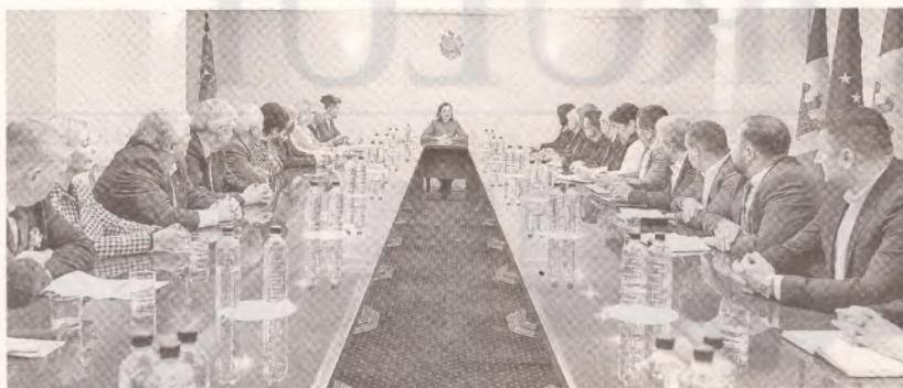
Întrevedere de lucru