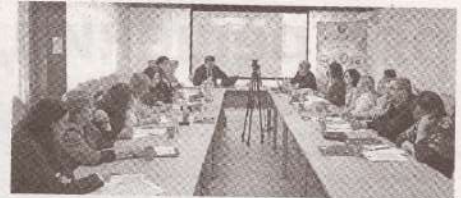
Женская комиссия CNSM как фактор равновесия в социальных событиях >> с.4