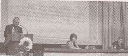
Выявление и обучение молодых профсоюзников – на повестке дня FSEŞ >> с.3