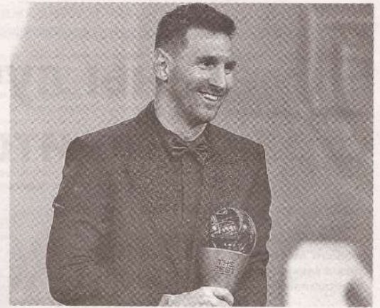
Гала-церемония FIFA The Best