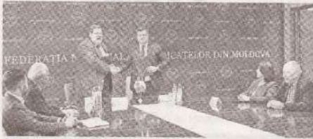
CNSM подписала с «Cartel ALFA» соглашение о правах мигрантов >> с.3