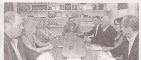
Культура должна стать приоритетным направлением госполитики >> с.4