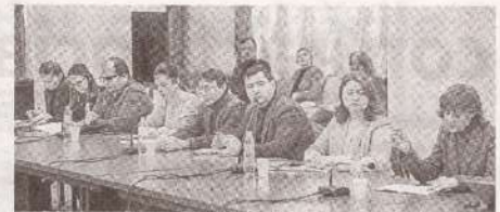
Planul Guvernului pentru 2023, propus spre dezbatere sindicaliștilor >> p.4