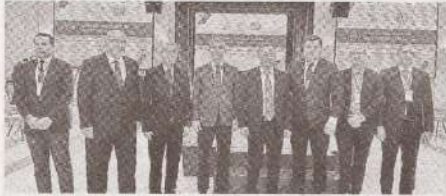
Forumul partenerilor sociali „Noul contract social: relații de muncă corecte” >> p.2