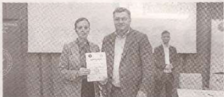
Forțe proaspete și tinere în echipa de formatori sindicali >>> p.3