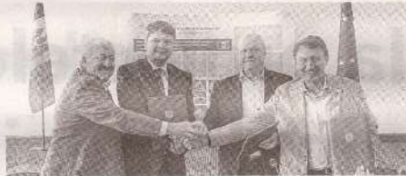
Partenerii sociali din construcții au semnat Convenția colectivă >>> p.4