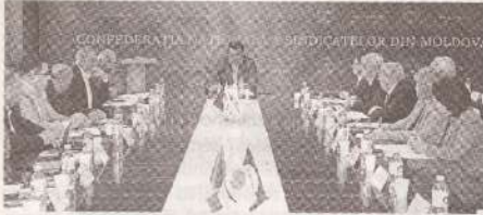
Comitetul Confederal a adoptat decizii importante vizând activitatea CNSM >>> p.2