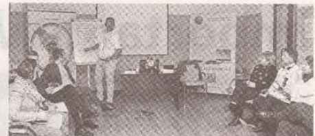
Comunicarea, esențială în recrutarea unor noi membri de sindicat >>> p.3