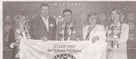
Защита уличных торговцев в центре внимания профсоюзов >>> с.4