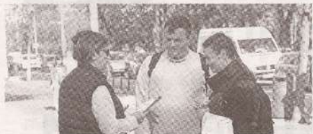
Достойный труд – не роскошь, а одно из основных прав человека >>> с.3