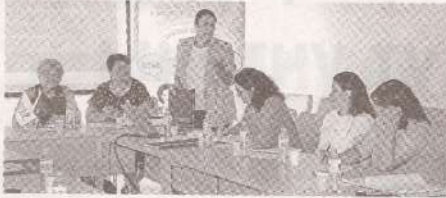
Профсоюзницы обсудили актуальные проблемы и приоритеты на будущее >>> с.2