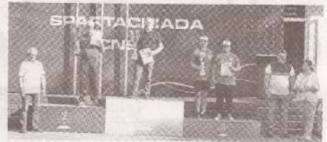
Спартакиада CNSM: соревнования, в которых победила дружба >>> с.6-7