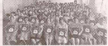
Профсоюзники сферы образования >>> с.4 из Хынчешть обозначили свои приоритеты