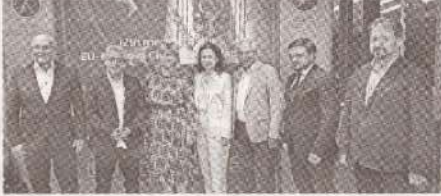
Роль профсоюзов в процессе вступления Р. Молдова в Европейский союз >>> с.3