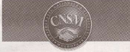
ПЕРИОДИЧЕСКОЕ ИЗДАНИЕ НАЦИОНАЛЬНОЙ КОНФЕДЕРАЦИИ ПРОФСОЮЗОВ МОЛДОВЫ