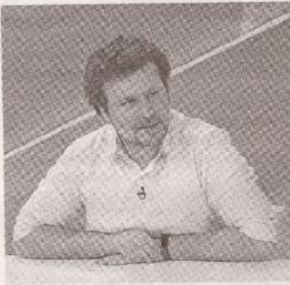
(Продолжение. Начало на стр. 1)

Две недели назад министр Дан Перчун встретился с выпускниками педагогического профиля и отметил, что действительно зарплата имеет большое значение, но молодые люди также говорили об обстановке в школе, о том, как их принимают в