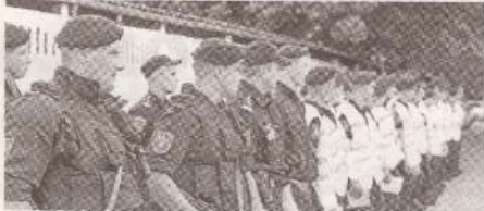
Пересмотр зарплат в сфере общественного порядка и безопасности на повестке дня >>> с.3