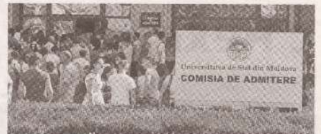
Университеты Молдовы становятся все более привлекательными для молодежи >>> с.5