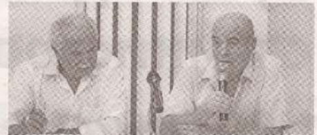
Проблемы в сельском хозяйстве и пути их решения >> с.3