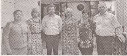
Лидеры FSEȘ обсудили с министром образования неотложные вопросы >> с.2