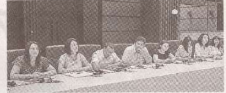
Ратификация Конвенции МОТ № 190 в поле зрения рабочей группы >>> с.3