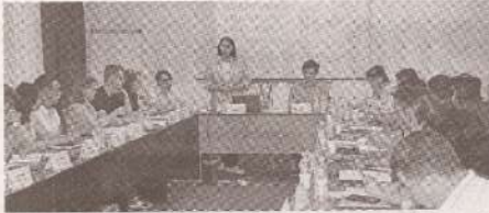
Молодых профсоюзников ознакомили с возможностями интеграции на рынке труда >>> с.2