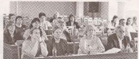
Профсоюзные лидеры из Орхей – пример мужества в решении проблем