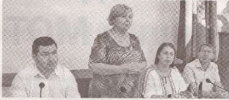
Кампания «Первичная организация – энергия профсоюзного движения» в Унгень