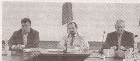
Politica fiscală și vamală pentru anul 2024, dezbătută în ședința CNCNC >>> p.3