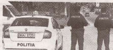
Cei care apără ordinea de drept se vor simți mai protejați de acum încolo >>> p.4