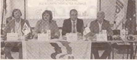
Профсоюзники обсудили изменения климата и будущие реформы >>> с.3