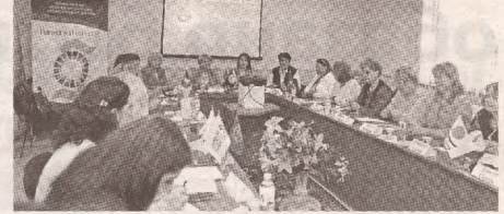
Профсоюзницы выступают за лучшую жизнь через конкретные действия >>> с.7