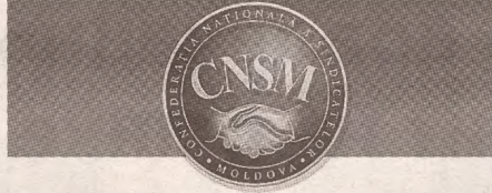
ПЕРИОДИЧЕСКОЕ ИЗДАНИЕ НАЦИОНАЛЬНОЙ КОНФЕДЕРАЦИИ ПРОФСОЮЗОВ МОЛДОВЫ