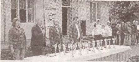
Spartachiada angajaților din educație: a învins prietenia >>> p.3