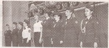
Familia sindical-polițienească a făcut furori, demonstrând abilități >>> p.4