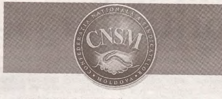
PUBLICAȚIE PERIODICĂ A CONFEDERAȚIEI NAȚIONALE A SINDICATELOR DIN MOLDOVA