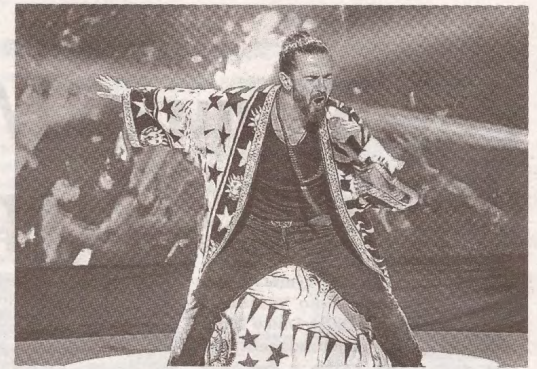
Искусство без границ