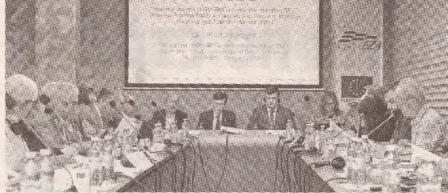
Коллективные переговоры в многонациональных компаниях >> с.2