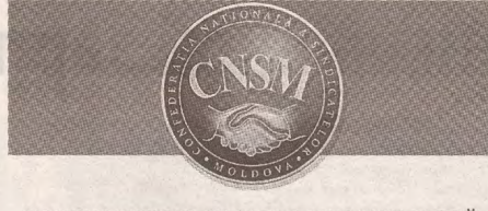
ПЕРИОДИЧЕСКОЕ ИЗДАНИЕ НАЦИОНАЛЬНОЙ КОНФЕДЕРАЦИИ ПРОФСОЮЗОВ МОЛДОВЫ