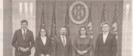
Наша страна присоединилась к Механизму соединения Европы >> с.3