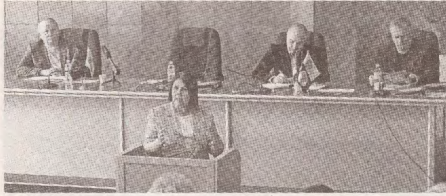
Campania „Organizația primară - energia mișcării sindicale” a poposit la Bălți >> p.3