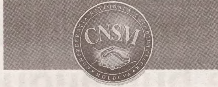
PUBLICAȚIE PERIODICĂ A CONFEDERAȚIEI NAȚIONALE A SINDICATELOR DIN MOLDOVA