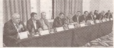
USM, partener și invitat permanent >> p.4 la reuniunile Consorțiului Universitaria