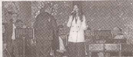
«Sărut femeie mâna ta!» – душевный >>> с.4 праздник для женщин-профсоюзниц