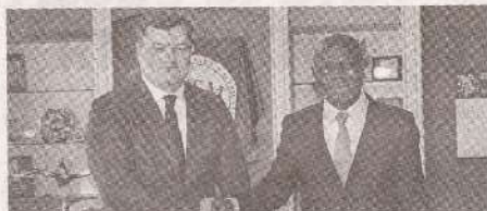
Благодарственное письмо от генерального директора МОТ Гилберта Ф. Хунгбо >>> с.2