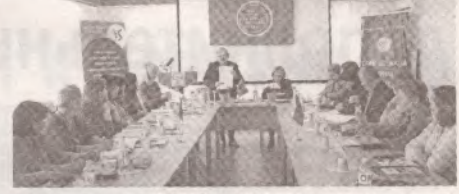
Федерация «SindLUCAS» на пути достижений и свершений >> с.5