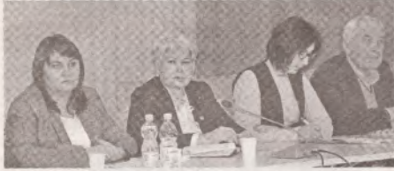
Коллективный трудовой договор – источник прав для работников >> с.2