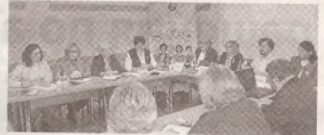
Профсоюзницы обсудили проблемы женщин и предложили пути их решения >>> с.4