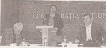
Конфедеральный комитет CNSM принял решения по актуальным вопросам >>> с.2