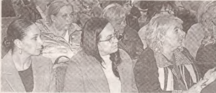
Основная проблема в учебных заведениях – нехватка педагогических кадров >> с.3