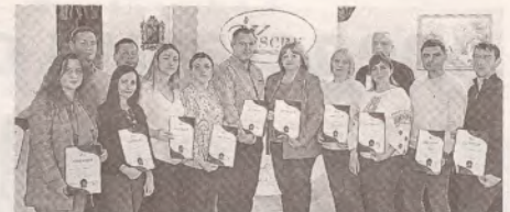
Обмен передовым опытом между профсоюзниками с обоих берегов Прута >> с.4