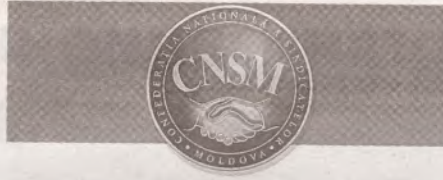
ПЕРИОДИЧЕСКОЕ ИЗДАНИЕ НАЦИОНАЛЬНОЙ КОНФЕДЕРАЦИИ ПРОФСОЮЗОВ МОЛДОВЫ