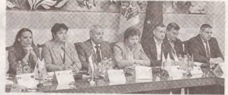
Благополучие возможно только в большой европейской семье >>> с.5