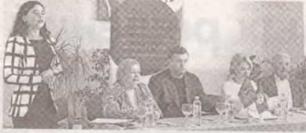
В профсоюзном движении первичная организация – основная структура >>> с.3