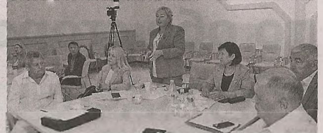
Наши коллеги – соль земли. Поддержим их словом и делом >> с.5