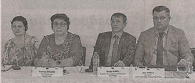
Проблемы работников по обе стороны Прута обсуждены в Румынии >> с.2