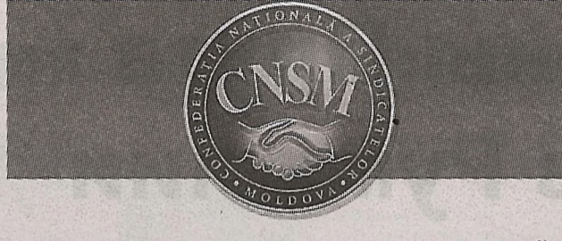
ПЕРИОДИЧЕСКОЕ ИЗДАНИЕ НАЦИОНАЛЬНОЙ КОНФЕДЕРАЦИИ ПРОФСОЮЗОВ МОЛДОВЫ