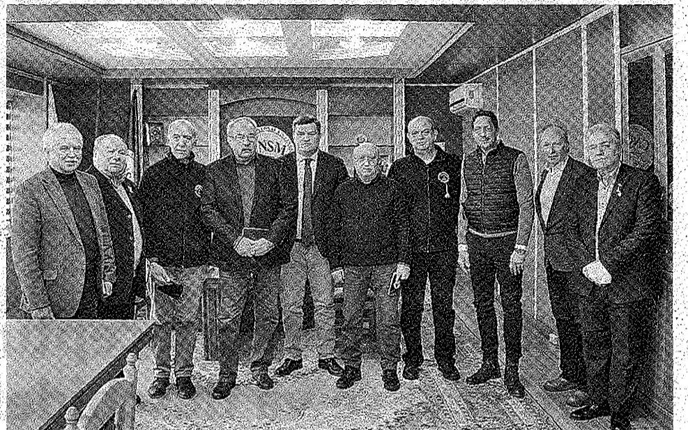
După întâlnirea delegației Organizației Internaționale Umanitare cu conducerea CNSM

Organizației Internaționale Umanitare de a acorda ajutoare pentru refugiații din Ucraina, constând în medicamente, consumabile ș. a.