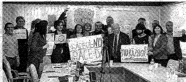
Consiliul Federației Sindicatelor >>> p.4 din Comunicații și-a trasat prioritățile