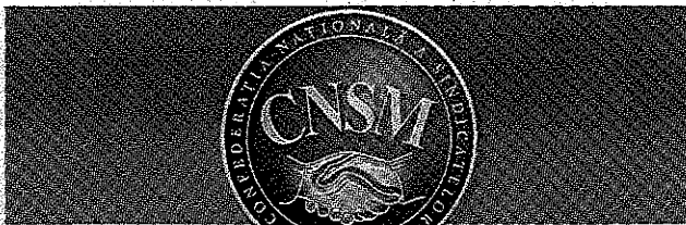
PUBLICAȚIE PERIODICĂ A CONFEDERAȚIEI NAȚIONALE A SINDICATELOR DIN MOLDOVA