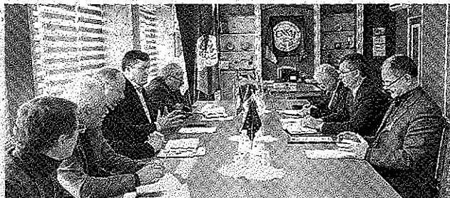
Securitatea muncii să corespundă >>> p.2 standardelor internaționale